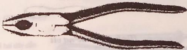
Hình 1-1 Kim thường