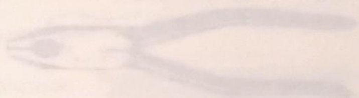
Hình 1-1 Kìm thường

200mm: Dùng vào các công việc uốn dây dẫn